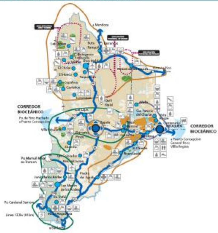
Programa de Fortalecimiento y Estimulo a Destinos Turísticos Emergentes (PROFODE) Dirección de Desarrollo de la Oferta - Secretaría de Turismo de la Nación